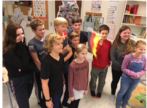
Udvekslings elever og deres makkerer fra Nørreåskolen.