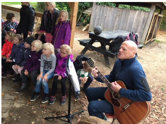
En hyggelig fredagssamling i bålhytten